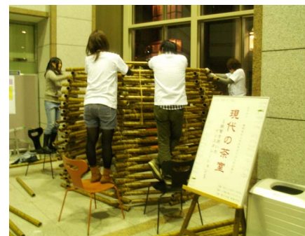
《夜遅くまで作業する建築デザイン展スタッフ“STA+”》