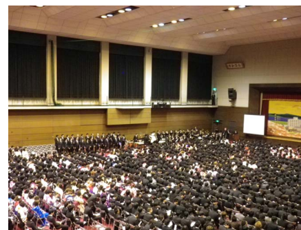
《学位記授与式の風景》