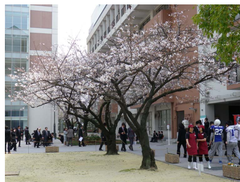
《新入生を迎えるサクラ》